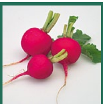
Radieschen Mai – September