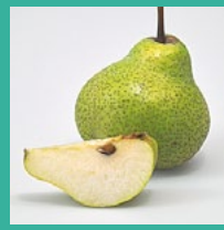
Birnen August – April (je nach Sorte)