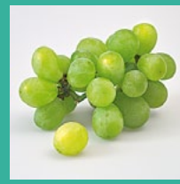
Trauben September – November