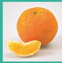
Orangen November – Februar*