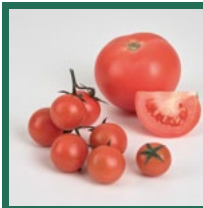
Tomaten Juni – September