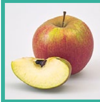
Äpfel ganzjährig (je nach Sorte)