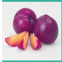
Pflaumen/ Zwetschgen August – Oktober