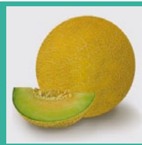
Melonen Juni – Oktober*