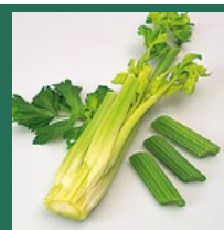
Stangensellerie Mai – September