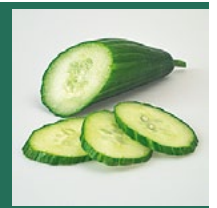
Gurken April – Oktober