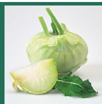
Kohlrabi März – November