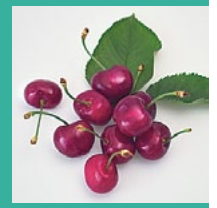
Kirschen Juni – August (je nach Sorte)