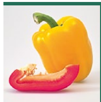
Peperoni Juli – Oktober