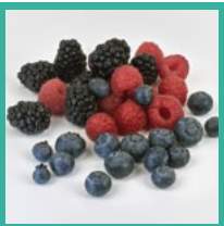
Beeren Juni – Oktober (je nach Sorte)