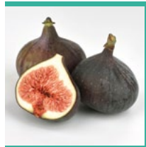
Feigen Juni, Juli, September*