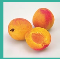
Aprikosen Juni – August