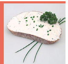
Frischkäse/ Hüttenkäse auf Brot