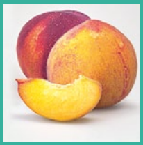
Nektarinen/ Pflirsiche Juni – August*