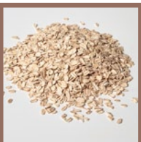
ungesüsste Flocken (z.B. Hafer, Hirse etc.)