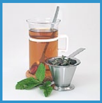
Tee ohne Zucker