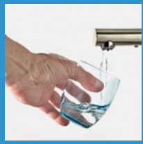
Wasser Leitungs- oder Mineralwasser**